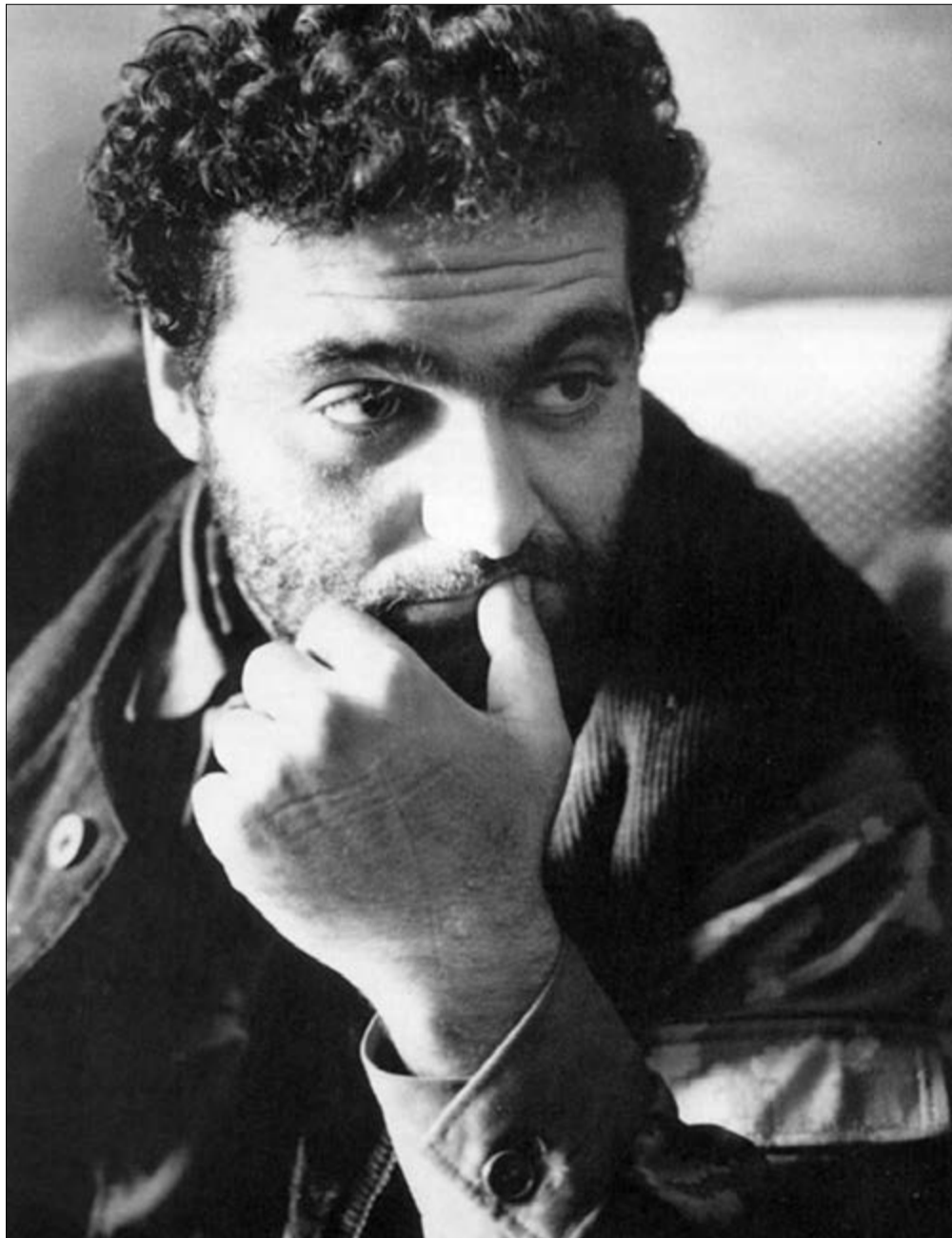
Վազգեն Սարգսյան, Սպարապետ Հայոց

Աշտարակից Ուջան, ելեւեջուն ճանապարհով, ցեխ ու անձրեւի, արեւ արթա- յության, ծյուն ու բքի միջով փոքրամարմին մի մարդ է առաջանում, մանդոլինը թելի տակ, գլու- խը բարձր: Երգի դասատու է, 1918-19 թվերին, Պետերբուրգից՝ Թիֆլիս, Թիֆլիսից Երևան երթուղով է եկել: Իր կարեցածը հայ երեխային հայ երգ ուսուցանելն է: Ո՞ր գնամ, ասել է: Ու- ջան, ասել են: Երգվել ու գնացել է: Մանդոլի- նը թելի տակ, նպատակը հստակ: Տարիներ են անցել, կառավարություններ ու ղեկավարներ, նոտաներ ու երգեր են հաջորդել մեկմեկու, խմբերգերի միտումնալից զուլալ ծայրը խեղդ- վել, անձը մոռացվել է: Դասատուները հրահան- գիչ են դարձել, հրահանգիչները՝ քարտուղար, ինքն՝ իր երգումին հավատարիմ, իր նպատակը հստակ. հայ երեխային հայ երգ է պետք: Հի- սուն տարի իր արահետով գնացել-եկել է: Ոչ ոք